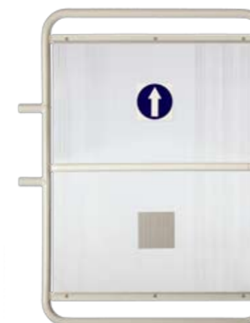
230811710 Anta ALU verniciato mm 700 DX 230811510 Anta ALU verniciato mm 700 SX 230811610 Anta ALU verniciato mm 900 DX 230811410 Anta ALU verniciato mm 900 SX