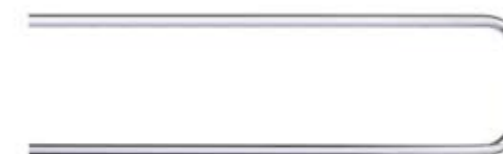
232850004 Battente cromato mm. 1150