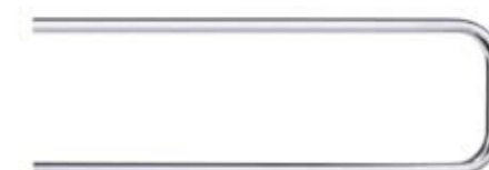
232880004 Battente cromato mm. 900