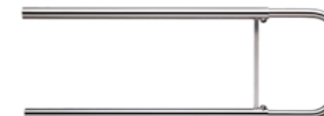
230283100 Battente cromato estensibile STD mm. 700/1100