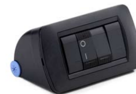
Consolle da Tavolo

Il kit comprende solo quanto disegnato in blu